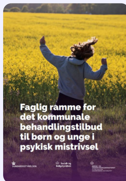
Psykoterapeuter MPF fremgår nu som en faggruppe, der kan bruges som behandlere i det nye kommunale tilbud til børn og unge i mistrivsel

Foreningen deltog også aktivt i Psykiatridagene 2023, hvor der var fokus på at fremme psykoterapiens rolle inden for psykiatrien. Denne deltagelse bidrog til en større forståelse og anerkendelse af psykoterapeuternes kompetencer og betydning i den bredere psykiatriske kontekst.